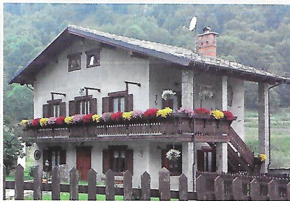
La bellezza dei fiori in questa calda estate