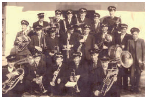
Banda musicale di Prali