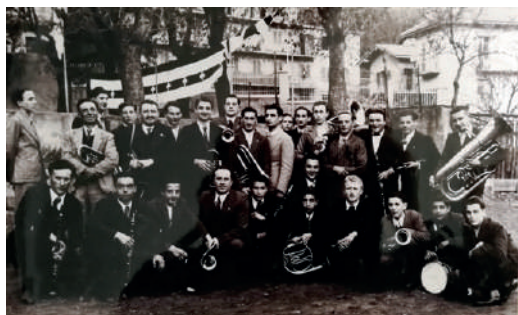
Foto della Banda dei Salesiani di Perosa Argentina all'inizio del dopoguerra