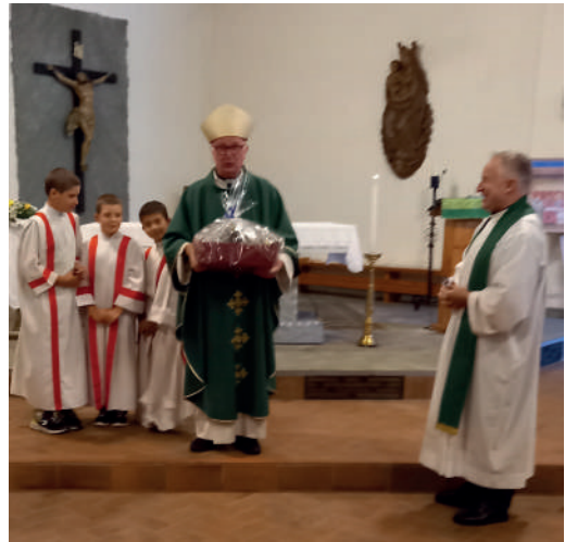
Domenica 30 luglio la S. Messa delle 17,30 è stata celebrata dal Vescovo Derio.

Nel mese di agosto sono stati raccolti generi alimentari per la CARITAS di zona e offerte per 590 euro. Grazie per la generosità e la solidarietà dimostrata.